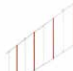
Шторка під стрілу довжиною 2 м**