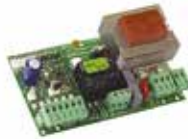
Плата управління 615 BPR