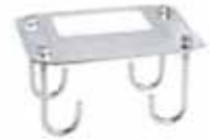
Монтажна пластина до B614