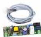
Комплект підключення дюралайта для круглої стріли S (тільки для шлагбаума 615)