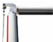
Шарнірний вузол для круглої стріли S