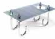
Монтажна пластина до 615