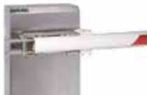
Кріплення для круглої поворотної стріли (нержавіюча сталь)