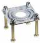
Монтажна пластина для опорної стійки