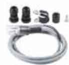
Комплект підключення дюралайта для круглої стріли S/L для шлагбаума B614/620/B680