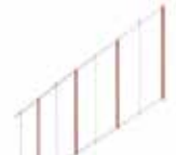
Шторка під стрілу довжиною 3 м**