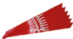
Комплект світловідбиваючих наліпок