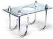
Монтажна пластина до 620