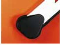
Кронштейн для кріплення прямокутної стріли